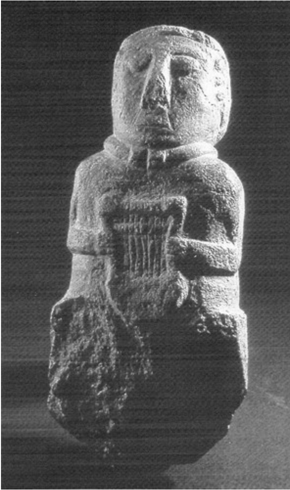
Paule. Statue de personnage masculin à la lyre.

associé : ils sont attribués à une fourchette chronologique relativement large, qui s'étend de la fin du III ème siècle, jusqu'au milieu du I er siècle av. J.-C. Compte tenu de ces comparaisons, on pourrait proposer un intervalle de datation relative de la statue de Beaupréau relativement étendu, qui couvrirait la seconde moitié du III ème siècle et la première moitié du II ème siècle av. J.-C.