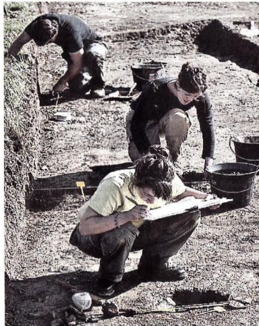
Le site de la Pierre-Aubrée n'a pas encore dévoilé tous ses secrets archéologiques.

Le matériel lithique récolté, soit une soixantaine de pièces, atteste d'un approvisionnement en matières premières venues de sources éloignées de 30 à 80 km, localisées à l'Est du site de la Pierre-Aubrée. Cependant,