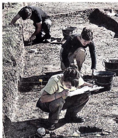
Plusieurs objets du néolithique ont été découverts, comme des fragments de poterie ou des lames de silex. Le chantier de l'été dernier a duré une quinzaine de jours.

Des fragments de poteries et de meules (outils servant à broyer les céréales) ainsi que des outils en silex ont été également découverts. Travaillant sur la vallée de l'Èvre depuis quelques années, les archéologues n'ont pas choisi le site de Beaupréau par hasard. « Il y avait des indices assez forts pour que le site date du néolithique. La projection aérienne de 1999 montrait la qu'il y a bien une enceinte circulaire. Tout le mobilier était cohérent avec une partie céramique et une autre en silex », explique Claira Lietar. S'il y a bien des traces de population et d'une en-