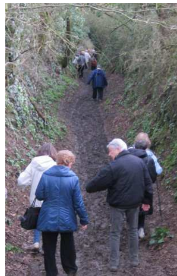
Retour vers Notre-Dame de Bon-Secours sous un ciel menaçant, à nouveau par le "chemin des canons".