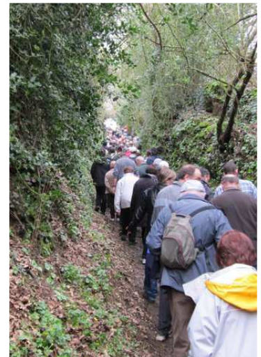
...explications sur la "planche à l'eau" au passage du pont qui enjambe le Beuvron, et au cours de la montée du "chemin des canons" (par Guy Bourchenin).