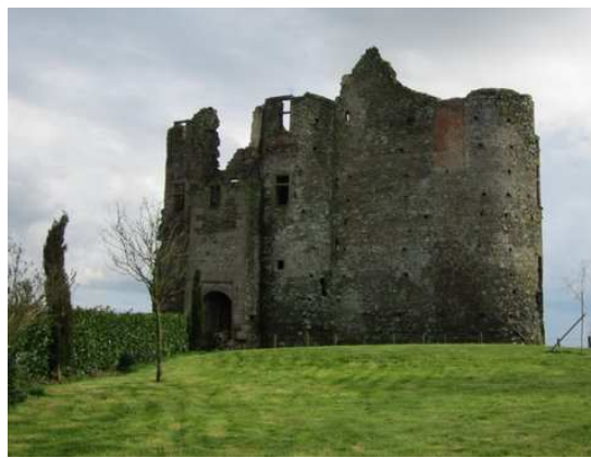
Des membres du groupe d'histoire d'Andrezé nous retracent le passé du château des Hayes-Gasselins.