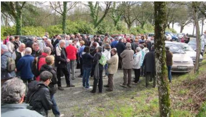
Les randonneurs avant le départ

Pour les organisateurs, ce fut un succès qui les encourage à mettre sur pied d'autres parcours riches en histoire.