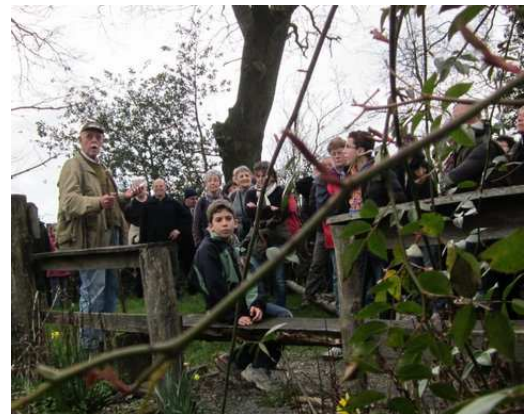
Histoire de "Jeanne qui court", ...