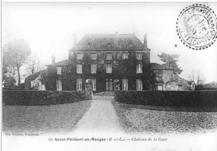
66. Saint-Philbert-en-Mauges (M -r(1-L), — Château de la Cour