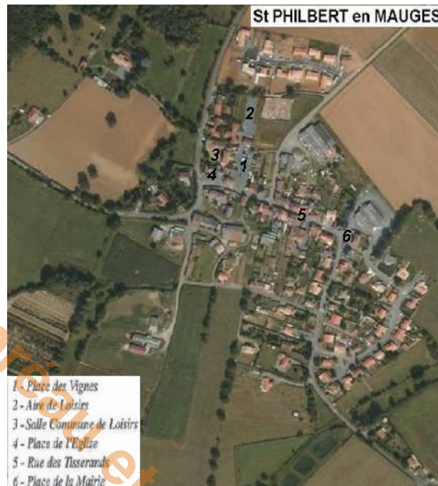
Plan du Village

Livret du Circuit des Guerres de Vendée éditée par l'Office de Tourisme du Val de l'Evre (St Philbert pages 22-23)