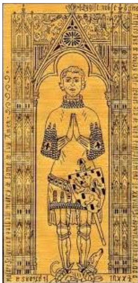
Modèle de pierre tombale

Malheureusement on n'a pas pu traduire le nom de ce frère.