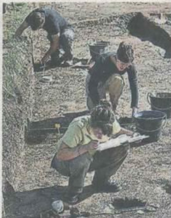
Plusieurs objets du néolithique ont été découverts, comme des fragments de poterie ou des lames de silex. Le chantier de l'été dernier a duré une quinzaine de jours.

Des fragments de poteries et de meules (outils servant à broyer les céréales) ainsi que des outils en silex ont été également découverts. Travaillant sur la vallée de l'Erdre depuis quelques années, les archéologues n'ont pas choisi le site de Beaupréau par hasard. « Il y avait des indices assez forts pour que le site date du néolithique. La projection aérienne de 1999 montrait la qu'il y a bien une enceinte circulaire. Tout le mobilier était cohérent avec une partie céramique et une autre en silex », explique Claira Lietar. S'il y a bien des traces de population et d'une en-