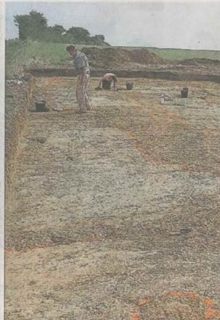
Le site de la Pierre-Aubrée n'a pas encore dévoilé tous ses secrets archéologiques.

certaines lames sont produites dans un silex qui affleure dans la région de Thouars (Deux-Sèvres). Le grattoir, outil à usage multiple utilisé particulièrement pour le travail de la peau, est majoritaire. Les pointes de flèche servent pour la chasse.