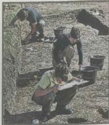
De nouvelles fouilles sont prévues en juillet.