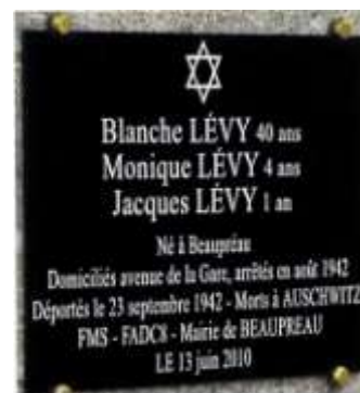
Monument aux Morts, Beaupréau, plaque inaugurée le 13 juin 2010, collection particulière.