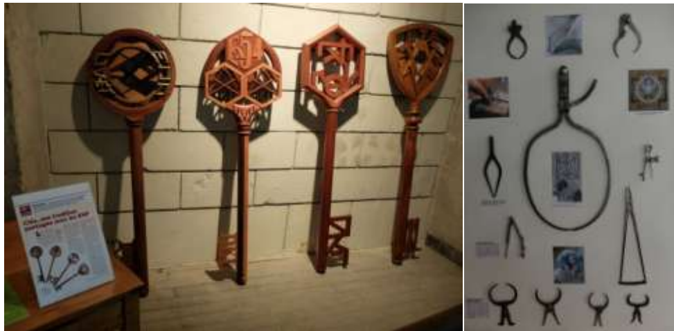
Les clés des promotions, et les compas