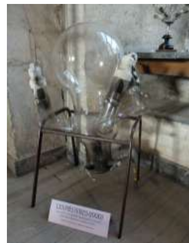
Une ampoule (redresseur de courant)