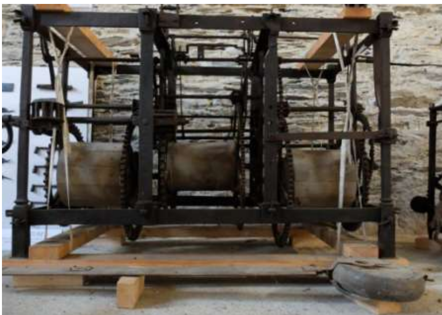
Le mécanisme de l'horloge de l'école de Beaupréau.