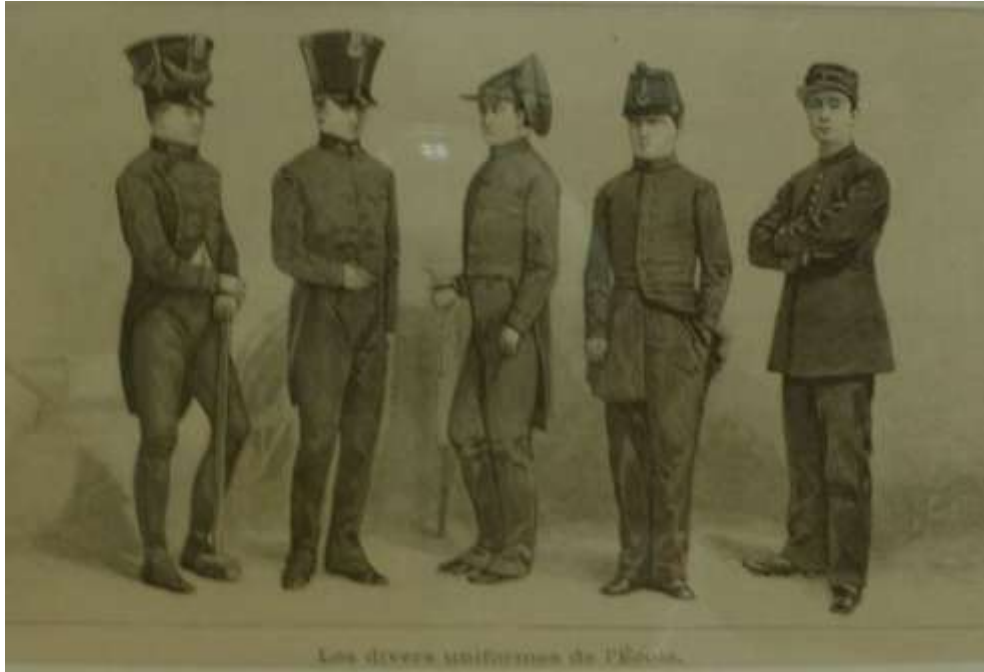
Les uniformes au fil des âges

Quelques photos pour illustrer cette visite.