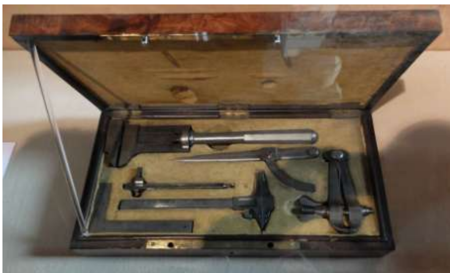
Une mallette d'outil réalisée par un élève