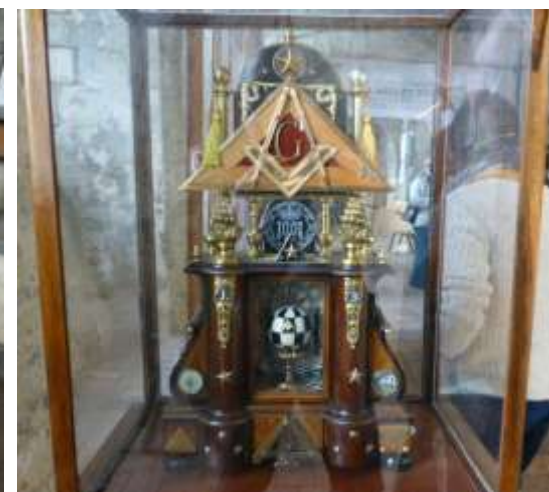
Une œuvre de fin de promo. On distingue le compas et l'équerre, symboles aussi de franc-maçonnerie.